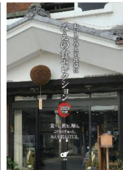
バイヤー向け冊子 「みえの食セレクション 選定品カタログ」