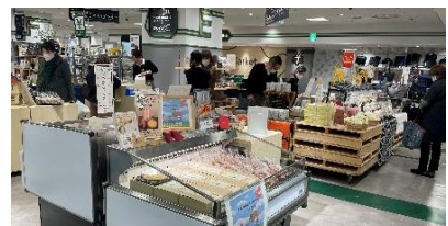
選定品販売イベントの実施