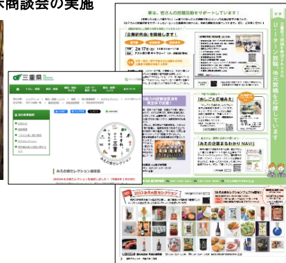
三重県ホームページや県政だより等 への掲載