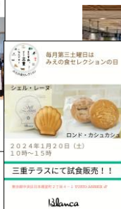
東京「三重テラス」での試食販売 毎月第3土曜日は みえの食セレクションの日