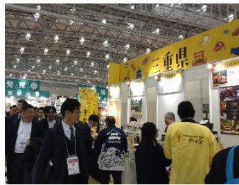
大都市圏での 展示商談会の実施