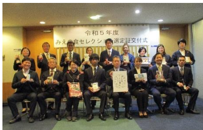
選定品発表会の様子